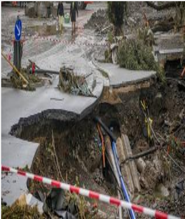
Ahr folyó áradása (Rajnavidék Pfalz)