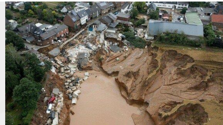
36 mp alatt keletkezett sárlyuk