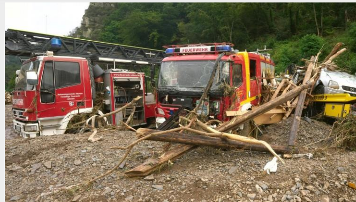
Mentésben résztvevő járművek is megsérültek