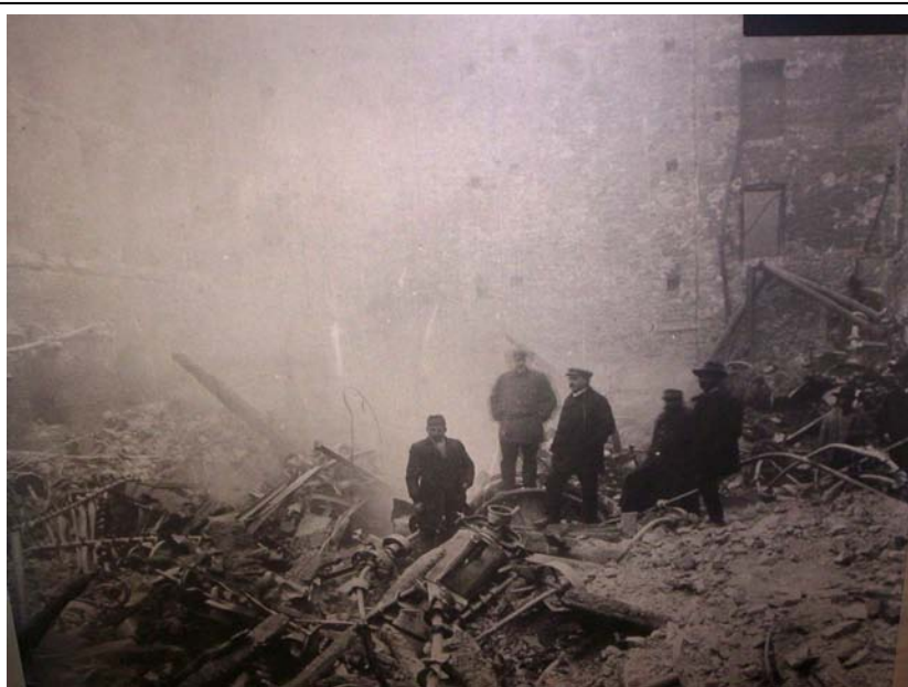
5. kép. A Hungária malom az 1909. november 3-i tűz után

A tüzet már-már lokalizálták, amikor váratlan esemény zavarta meg a küzdelmet, a raktárépület padlásán robbanás történt. A robbanás után a lámpák hirtelen kialvása miatti sötétségben és a nagy füstben többen csak nehezen tudtak menekülni. A malmot borító füstben a tetőn lévők életéért is kellett szorítani, szerencsére az ablakokon keresztül biztonságos helyre jutottak. Ez az újabb veszedelem fenyegette a szomszédos Zwack-féle szeszgyárat. A szeszkészlet begyulladását a küzdők emberfeletti munkával megakadályozták. A kárt, mintegy 3 millió koronát, a biztosító megtérítette.