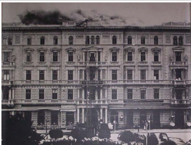
6. Kép. A Kecskeméti-utca 13. sz. ház tetőtüze