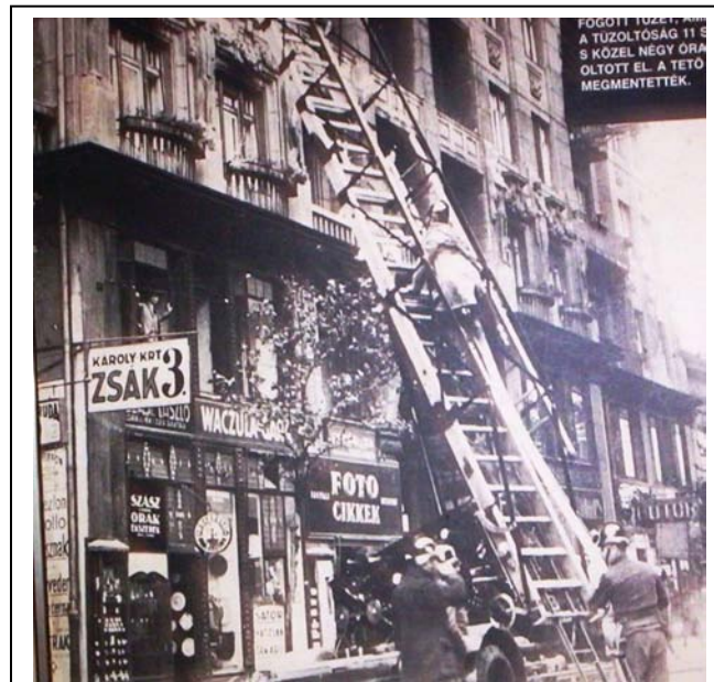
10. kép. Báthory utca 10. sz. négyemeletes ház tetőzetének égése

A tűz oka. Minden valószínűség szerint a tüzet a Rákóczi út felőli oldalon szabadon álló tűzfalra - függő munkaállványon - reklám-alapfestést végző munkások okozták. A munkaállványt csak a sötét padláson és tetőgerincen át tudták megközelíteni. A tűz kiváltója a dohányzással, vagy a padláson világításra használt gyufa használatával összefüggő gondatlanság lehetett.