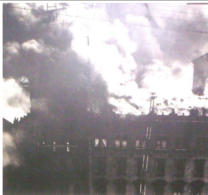
11. kép. A VIII. kerület József-körút 2. sz. alatti bérház tetőzetének égése

A tűzoltásban közreműködött 3 tiszt, 90 tűzoltó, az oltást 10 sugár végezte.