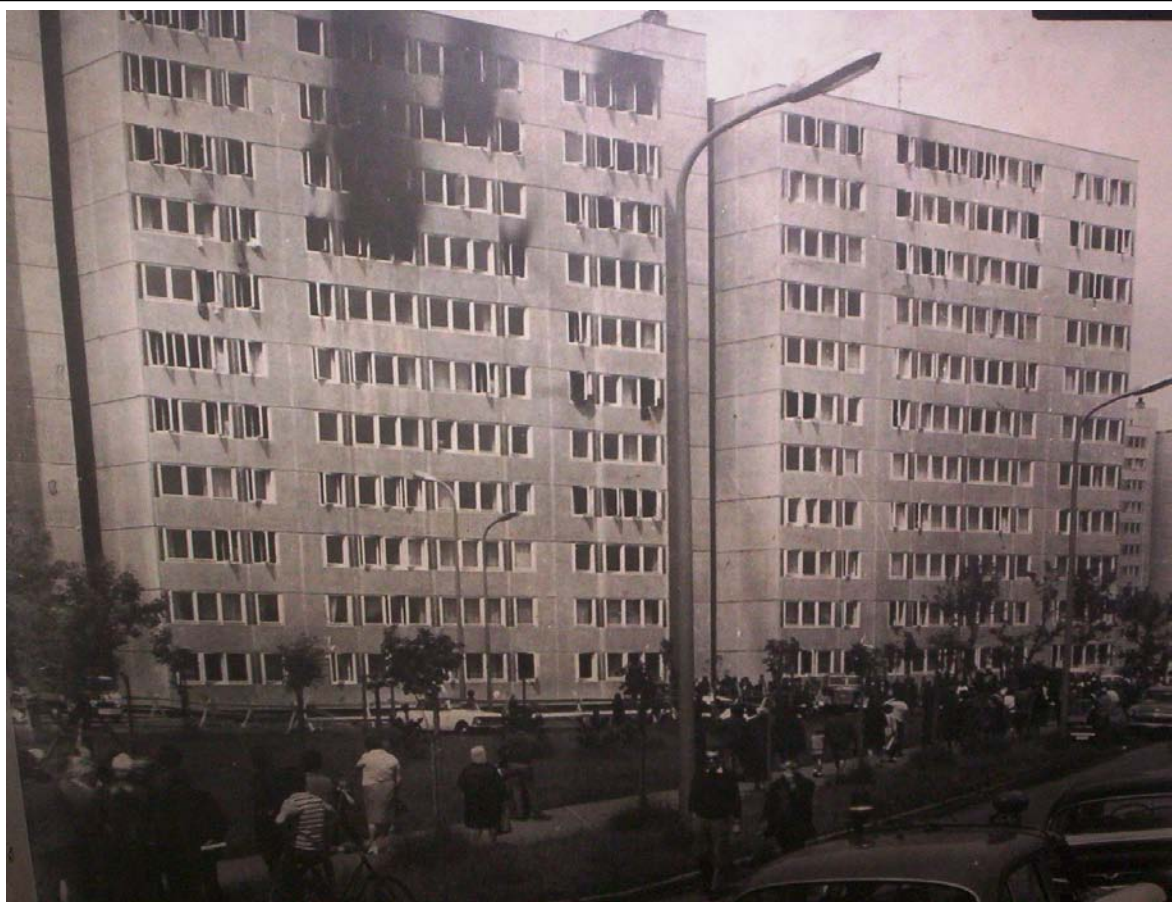
14. kép. Budapest XIV. kerület Csertő utca 12-14 sz. lakóépület az 1972. május 18-i tűz után

A tűz oltáshoz az elsőként érkezők alapvezetékét szereltek, a tolólétrát a Csertő utcai oldalon állították fel. Az alapvezeték osztóját a VI. emeleten helyezték el, és megállították a tűz lefelé terjedését, és megfékeztek a felsőbb emeleteken a lángokat. Később a veszélyeztetett emeletek szintjén még öt osztót szereltek. Ezekről 14 sugár oltott, illetve biztosította a menekülési útvonalat. Az életmentésre rendelt lánglovagok sok embert kísérték le az V emeletre.