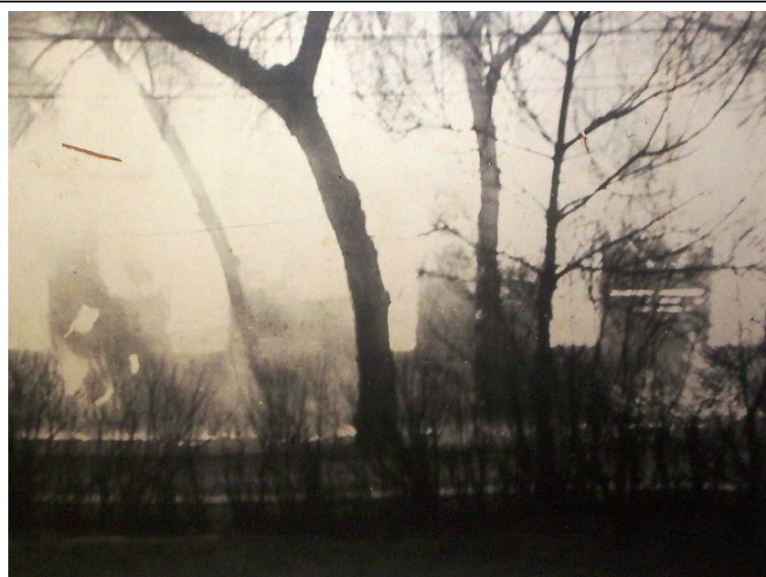
1. kép. A László Fertőző Kórház égése 1944. április 3-án

A kiállítás bevezető gondolata ez esetben is időszerű, ugyanis a képek itt is tanúsítják, hogy „felmérhetetlen az a kár, ami emberéletben és anyagi javakban az idők folyamán a tűz pusztításából keletkezett. Az emberi élni akarás a tűz okozta sebeket begyógyította. ... .. A nagy tüzesetekre ma is elszoruló szívvel emlékezünk.”