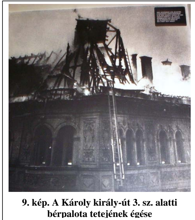
9. kép. A Károly király-út 3. sz. alatti bérpalota tetejének égése

Közben a Rákóczi út felől kritikussá vált a helyzet a padláster nyílttá vált tüze rohamosan terjedt az itt lévő két kupola is lánggra lobbant, az ide felhatolt csővezető munkája