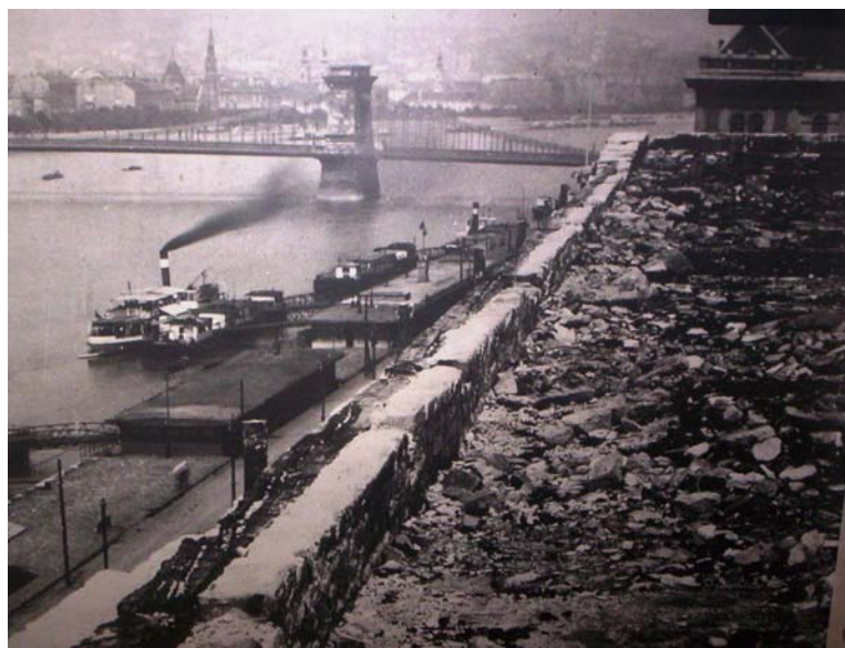
8. kép. A Magyar Általános Biztosító palotája a tetőtűz után

A tetőtűzet támadó hat sugár küzdelme egy órahosszat tartott, a takarítás még ugyanennyi időt vett igénybe, majd a küzdők szolgálati helyükre vonultak.