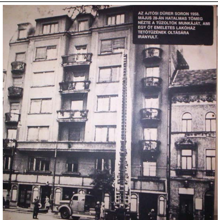
13. kép. Az Ajtósi Dürer sor ötemeletes lakóházának tetőtűze

A második világháborút követően is voltak nagy tüzesetek Budapesten és vidéken is, ezekből a galéria képei között az első az, amely 1956. február 4-én támadt a Keszthelyi Mezőgazdasági Akadémián ( 12. kép ). A tűz az épület tetejét elemésztette, a képen látható, hogy csak a kémények vészelték át a pusztítást.