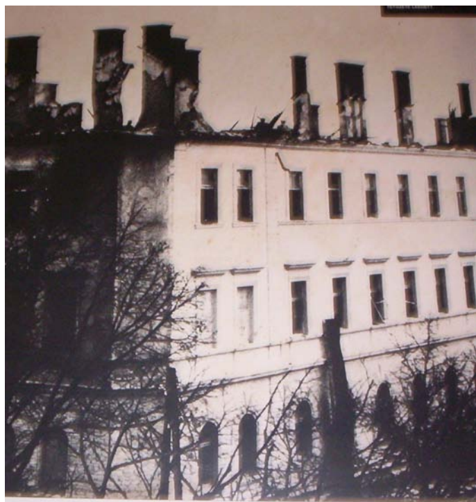
12. kép. A Keszthelyi Mezőgazdasági Akadémia leégett tetőzete

1958. május 28-án a Budapest XIV. ker. Ajtósi Dürer sor egyik ötemeletes lakóházának tetejére szökött fel a vörös kakas ( 13. kép ).