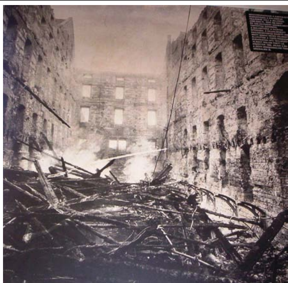
3. kép A Pesti Hengermalom az 1888. július 3-i tűz után

A Pesti Hengermalom (3. kép) a mai Balassi Bálint – Stollár Béla – Néphadsereg – Pálffy utca (V. kerület) által határolt területen kezdte meg működését 1841-ben. Ez volt az első gőzmalom, amely 1850-ben leégett. A malmot megnagyobbított korszerűbb változatban építették újjá. 1888. július 3-án újra a tűz martalékává vált.