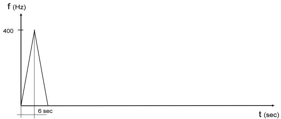
Morgató próba jelzés

A jelzés leírása: A próba során alkalmazott jelalak első részében 6 másodperces időtartamban 400 Hz-ig felfutó jelzés kerül leadásra, majd a jel lefutása következik be.