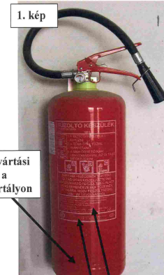
címke 5. rész