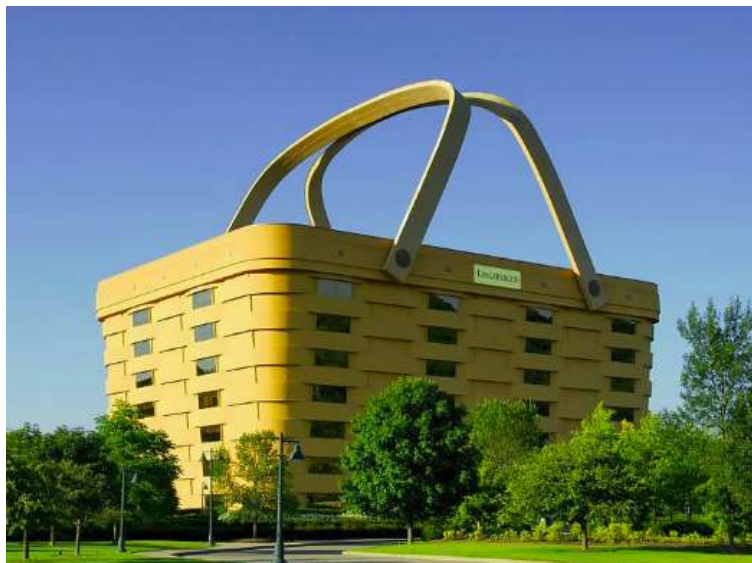
1. kép Longaberger kosárgyártó cég 1997-ben épült központi irodaépülete [1]