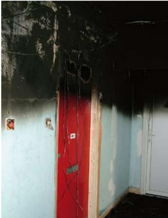
2009. tűzeset Miskolcon