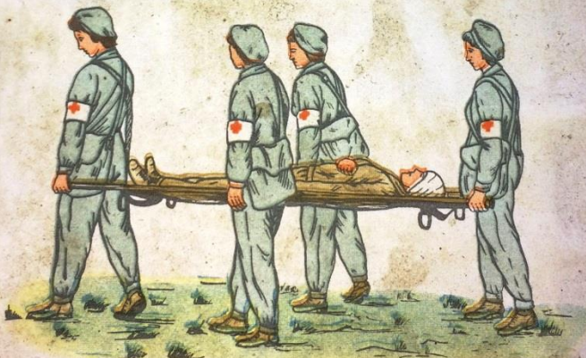
Переноска с носилками по ровной местности санитарными дружинниками

При повреждении груди пораженных переносят на носилках в полусидячем положении, положив им под спину одежду.