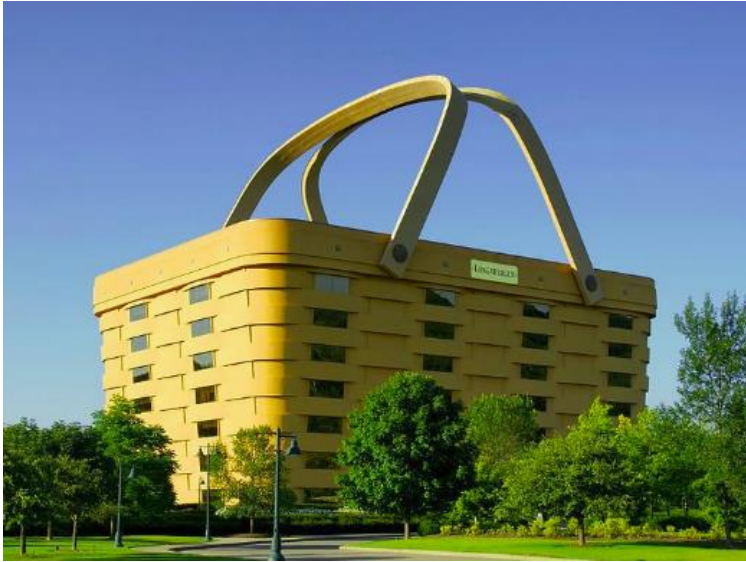
Kosárgyártó cég irodaépülete