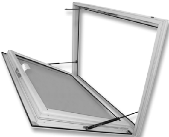
Exubaie V2 OS