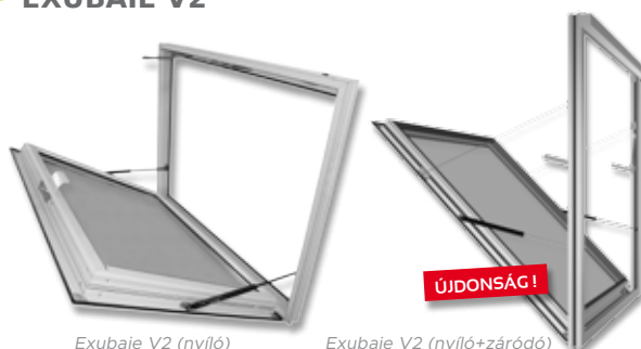
Exubaie V2 (nyíló)