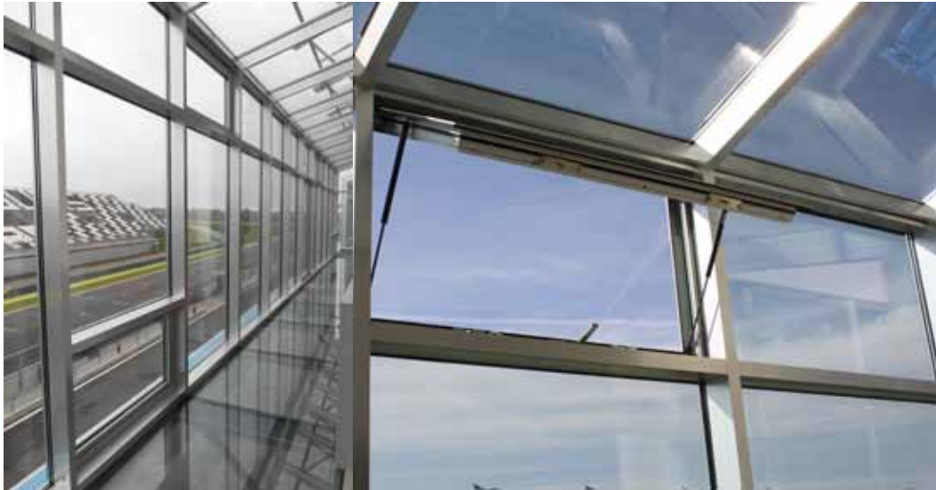
EXUBAIE V2 OS - A Magny-Cours Formula-1 versenypálya © Építész: Jean Bernigaud