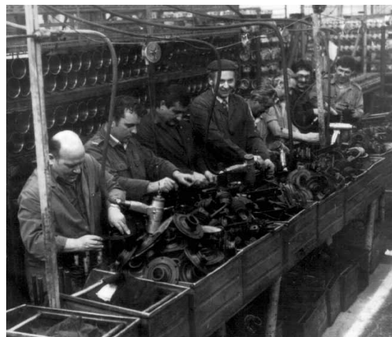
Sportbemutató országos tűzoltó versenyen (balra), társadalmi munka a Kismotor és Gépgyárban (jobbra)

A híradó szolgálat során az elméletben tanultakat gyakorolhatták be felügyelet mellett, ami a vonulós szolgálattal együtt egyben a pszichikai felkészítésüket is szolgálta. A gyakorlati felkészítést, a tapasztalatszerzést segítették azok a nagygyakorlatok, amelyeket az országos parancsnokság szervezett. A tisztképző és a tisztí átképző szakon tanulók gyakorló szolgálatot láttak el a Fővárosi Tűzoltóparancsnokság tűzoltási és tűzvizsgálói csoportjainál, valamint a területi parancsnokságokra való kihelyezések során mélyíthették el az elméletben tanultakat.