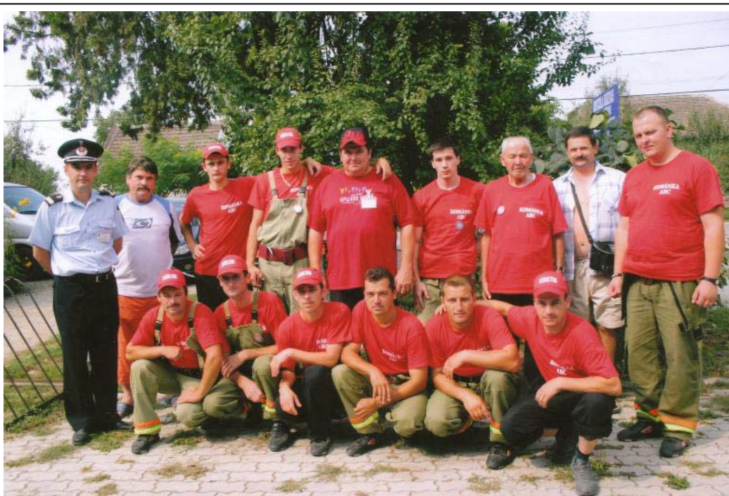
8. kép. A Sepsikőröspataki Önkéntes Tűzoltó Testület (2010)