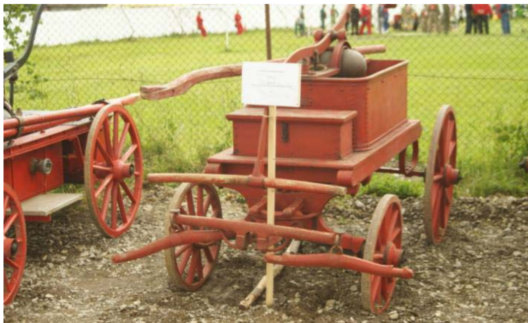
9. kép. Bikfalva kétlovas kocsifecskendője 1882-ből.