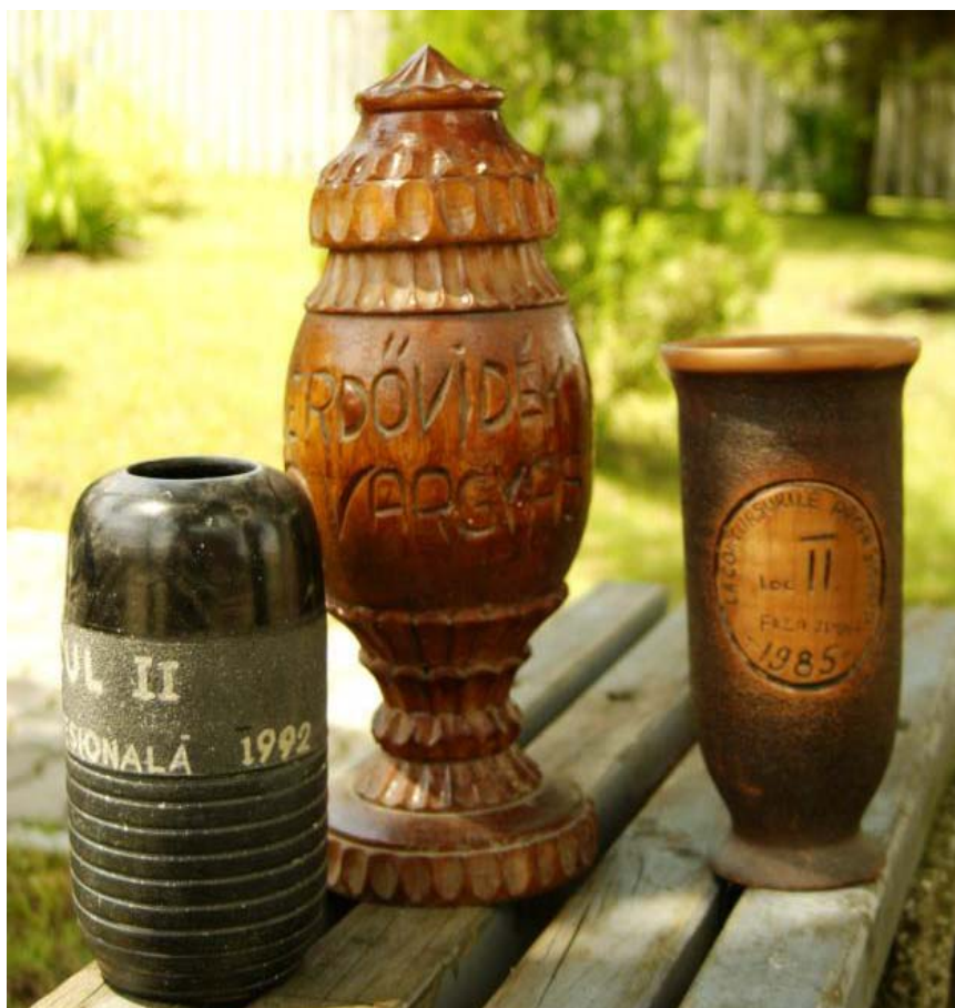
15. kép. A Bordoci Önkéntes Tűzoltó Testület által nyert kupák