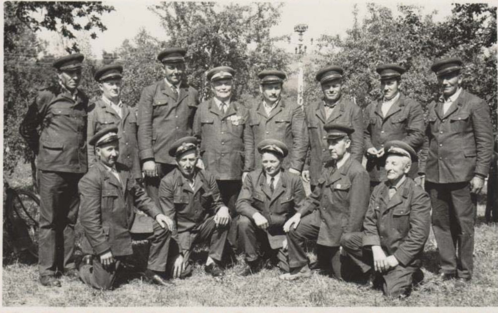
13. kép. Barátosi önkéntes tűzoltók (1980-as évek)