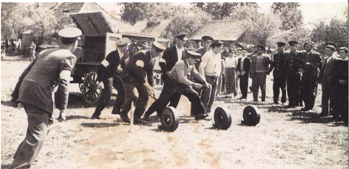
19. kép. Lemhényi tűzoltók körzeti versenyen Nyújtódon (1956)