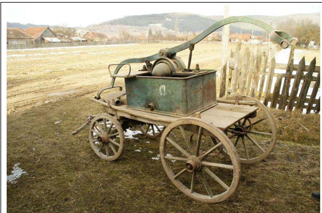
11. kép. Bélafalva négykerekű kocsifecskenője