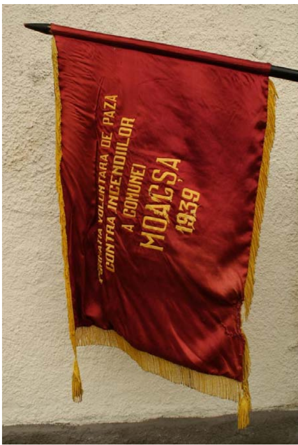
17. kép. Maksai Önkéntes Tűzoltó Testület zászlója (1939)