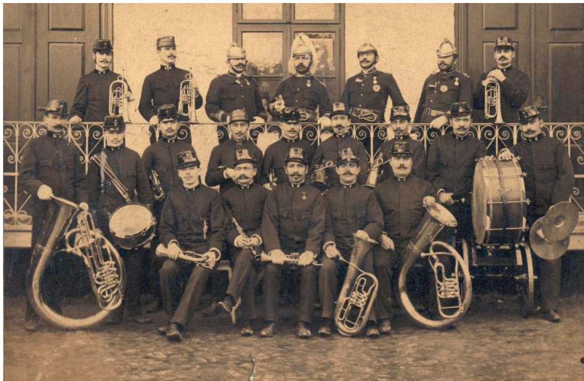
6. kép. A Sepsiszentgyörgyi Önkéntes Tűzoltó Testület zenekara (1894)