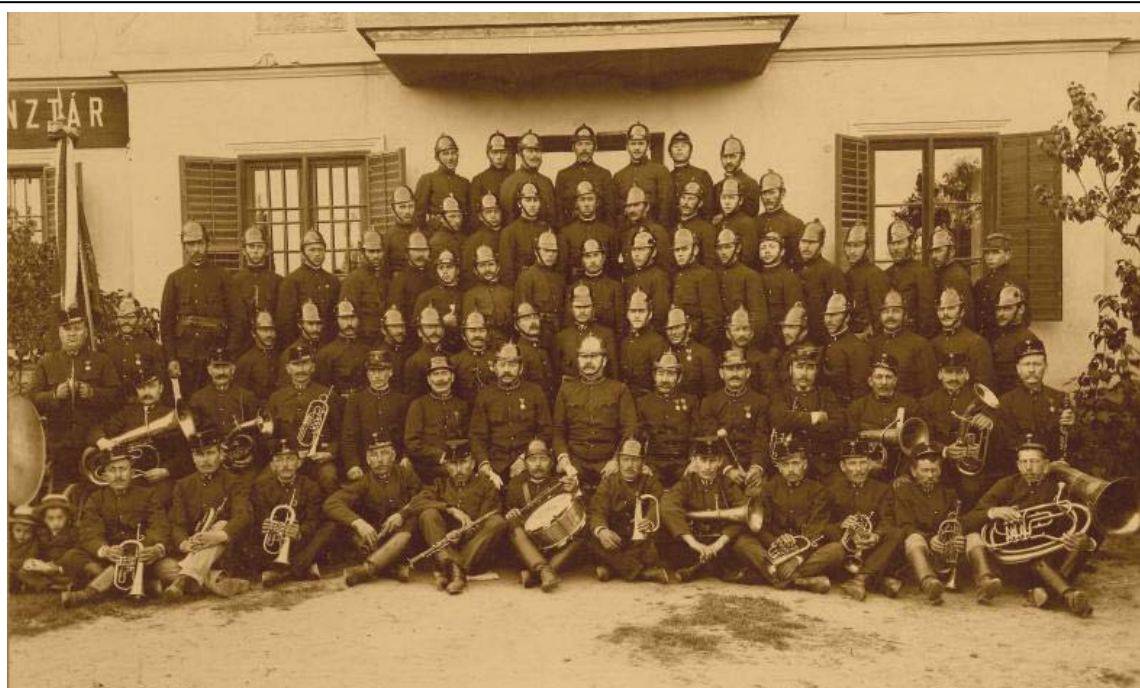
4. kép. Árkosi Önkéntes Tűzoltó Testület (1912)