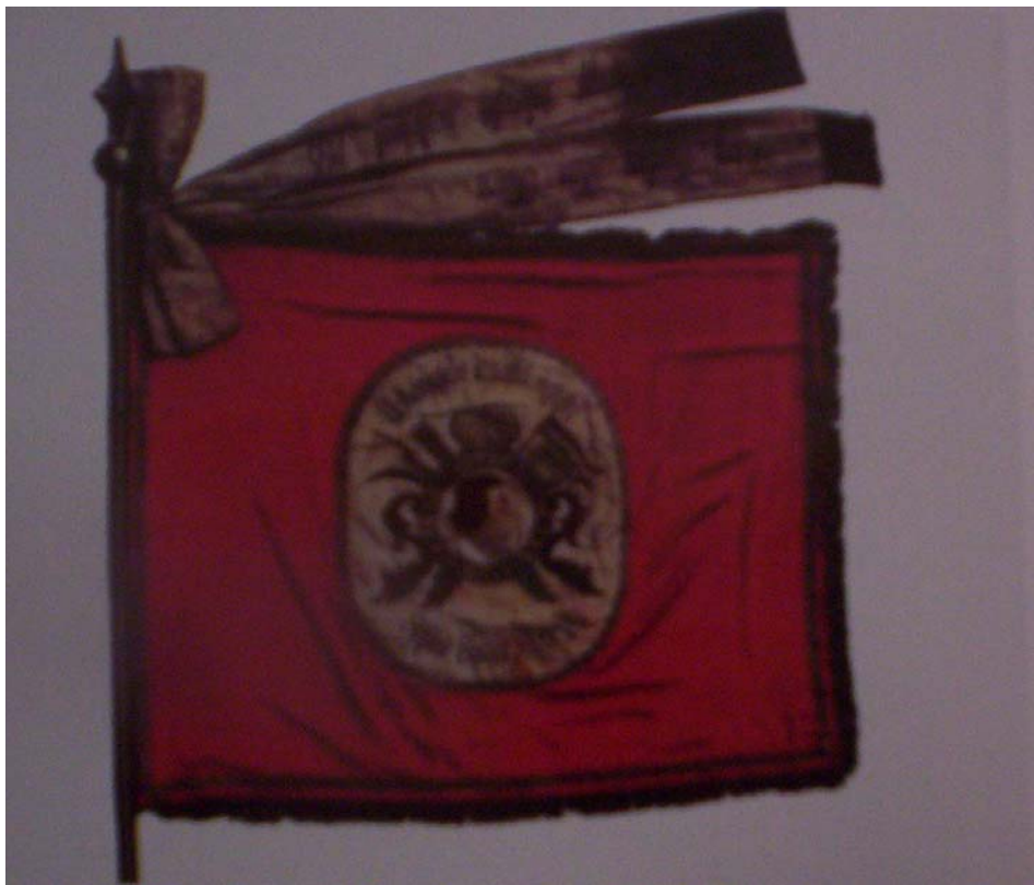
5. kép. A Sepsiszentgyörgyi Önkéntes Tűzoltóegylet zászlója (1895)