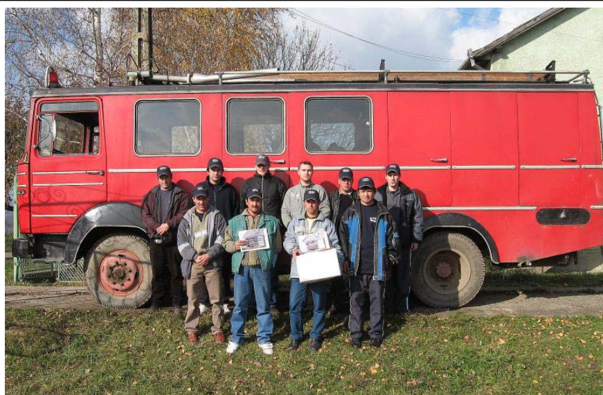
16. kép. Nagyajta község önkéntes tűzoltói gépjárműfecskejükkel (2007)