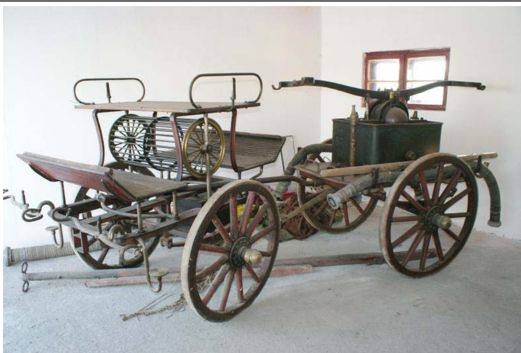
7. kép. Illyefalva 1899-ben gyártott kocsifecskendője