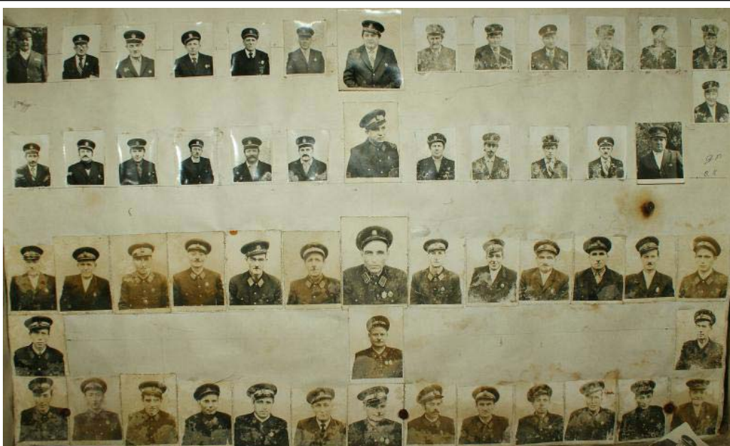
14. kép. A gelencei önkéntes tűzoltók négy nemzedéke