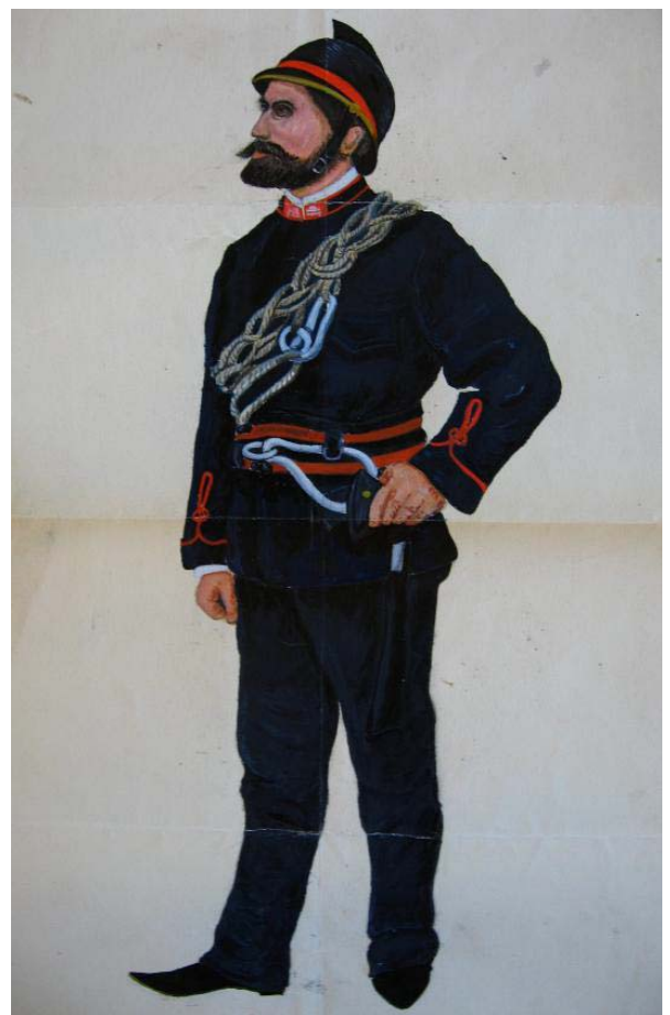
18. kép. A kézdivásárhelyi önkéntes tűzoltók egyenruhája