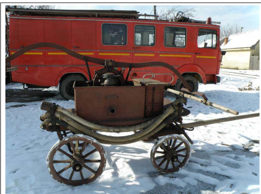
12. kép. Bereck község régi kocs- és újabb gépjárműfecskenője