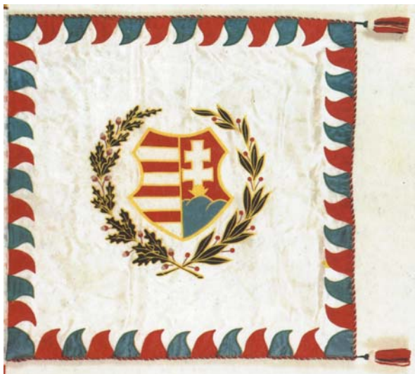
1.kép. 1848-as honvéd zászló

A zászló színével és ábrájával eszmeiséget fejez ki. Eredete, megszületése nemzetség, államiság