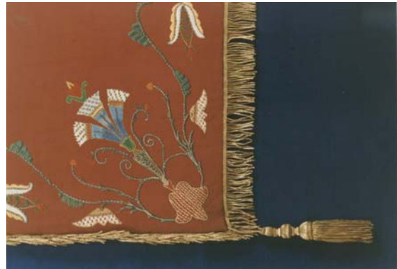
7. kép. Zászlóbojt és rojtozás