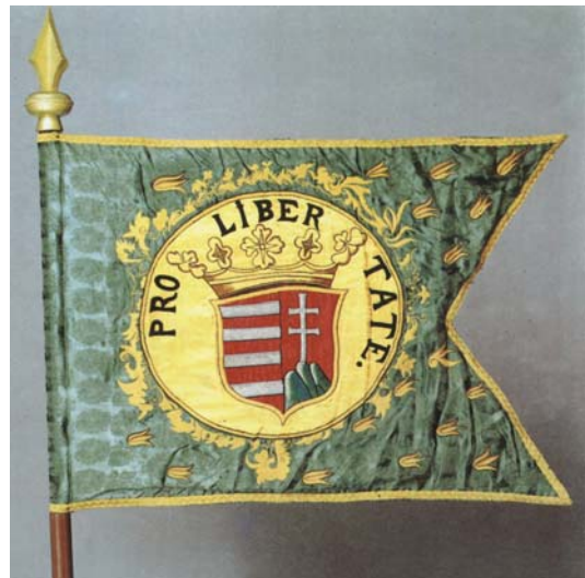
4. kép. Rákóczi kuruc zászlója