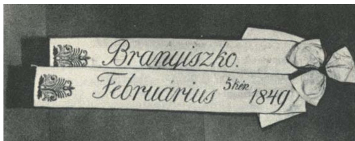
11. kép. Kétágú honvéd zászlószalag

A zászlószalagok méretük és kivitelezésük szerint igen változatosak. A lovasságnál használt szalagok rövidebbek és könnyebbek, mint a gyalogosoké. A szalagok rendszerint kétágúak (11. kép), de előfordul háromágú változat is. Az első szalagágra rendszerint jelmondat (nevezetes esemény, vagy annak helyszíne), a másodikra az adományozó neve (a nevezetes esemény időpontja), esetleg az alakulat megnevezése kerül.