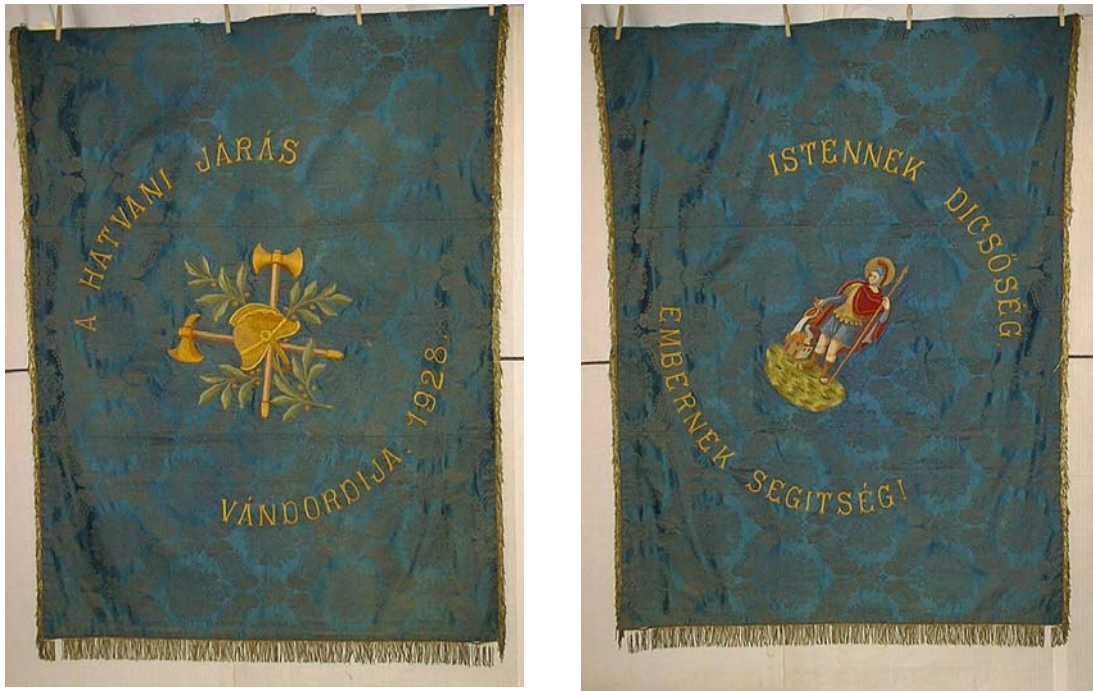
32a. és b. kép. A Hatvani Járási Tűzoltó Szövetség zászlójának két oldala