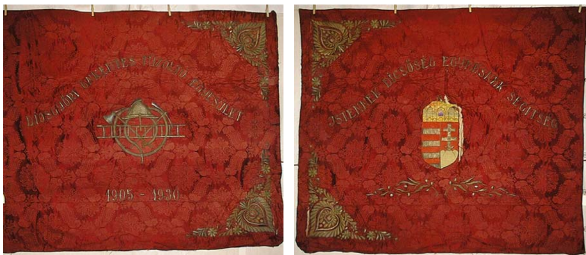
23a, és b. kép. A Diósgyőri Önkéntes Tűzoltó Egyesület zászlójának két oldala

A zászlóvásznon (vászonlap) mérete 150x134 cm. Vörös mintás batiszt selyem zászló, az egyik oldalán (23a. kép) aranszálakkal magasztott tűzoltó embléma (sisak, keresztbe tett balták, vízszintesen két-karú létra, körbefutó tömlő sugárcsővel. Az embléma fölött hullámvonalban haladó felirat: DIÓSGYŐRI ÖNKÉNTES TŰZOLTÓ EGYESÜLET , alul egyenes vonalban: 1905-1930 . A jobboldali két sarokmezőben magyaros virágmotívumok. A másik oldalon (23b. kép) középen a magyar koronás címer hímezve, alul két babérág. Felül hullámvonalban haladó felirat: ISTENNEK DICSŐSÉG EGYMÁSNAK SEGÍTSÉG . A baloldali két sarokmezőben magyaros virágmotívumok. A rúdra való felerősítéshez 13 karika van bevarrva a 134 cm hosszú oldalára.