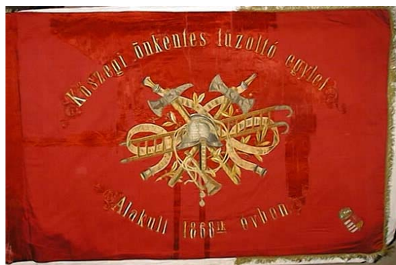
20a. és b kép. A Kőszegi Önkéntes Tűzoltó egylet zászlójának két oldala