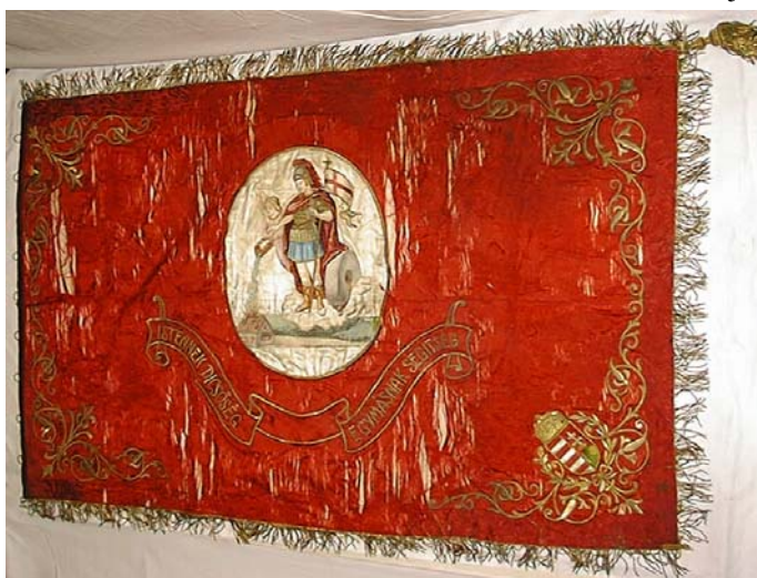
26a. kép. A Zalaszentgróti Önkéntes Tűzoltó Testület zászlójának egyik oldala

A zászlóvászón (vászonlap) mérete 150x96 cm. Vörösselyem alapú zászló. Az egyik oldalon (26a. kép) közepén rávarrott 49 cm magas ovális mezőben Szent Flórián hímzett alakja egy angyallal, dúsan hímzett sarokmezőkkel díszítve, a jobb alsó mezőben koronás magyar címer eredeti színekben. A Flórián motívumot alul övező szalagban levő felirat: a bal oldalon ISTENNEK DICSŐSÉG , jobb oldalon EGYMÁSNAK SEGÍTSÉG . A másik oldalán (26a. kép) dúsan hímzett sarokmezőkkel díszítve, közepén tűzoltó embléma rátett aranyszálakkal – sisak, két keresztbetett balta, létra, kürt zsinórral, két tömlő, az egyik sugárcsővel – 26 cm magas. Alatta tölgy és babérág, két oldalt középen balra az 1882 és jobbra az 1907 évszám, felül hullámvonalban haladva a: ZALASZENTGRÓTI ÖNK TŰZOLTÓ TESTÜLET felirat. Alul 1882 – 1907 évszámok. A bal alsó mezőben koronás magyar címer eredeti színekben. Az egyik szélén 12 karika látható, másik