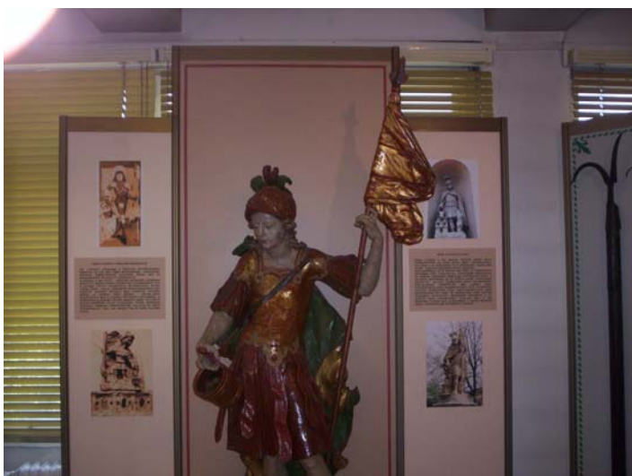
12. kép. Szent Flórián zászlóval a balkezeiben

A tűzoltók védőszentjének Szent Flóriánnak képi, vagy szoborként való ábrázolásakor a zászló szinte elmaradhatatlan kellék. Flórián katona volt – rendfokozat szerint százados, ilyen minőségében nem lehetett zászlóvivő. Tűzoltóként kezében zászlóval való megjelenítése nem az alkotó fantázia szabad szárnyalásának az eredménye (12. kép), sokkal inkább hihető az, hogy az alkotók a zászló kötelező kellékként való megjelenítésével, mégiscsak az egy közösséghez való tartozást a tűzoltói eszmeiséget akarták, akarják kifejezni.