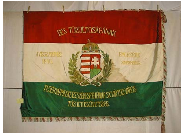
13a. és b. kép. A Dési Önkéntes Tűzoltó Egyesületnek adományozott zászló két oldala