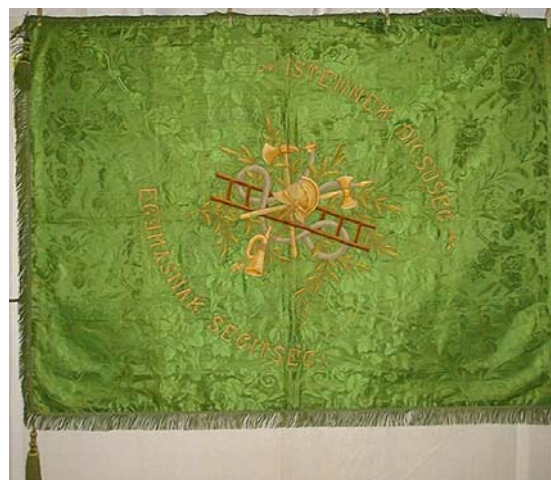
21a. és b kép. A Komáromi Önkéntes Tűzoltó Testület zászlójának két oldala