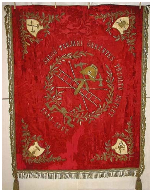
22a. és b. kép. A Salgótarjáni Önkéntes Tűzoltó Egylet zászlójának két oldala