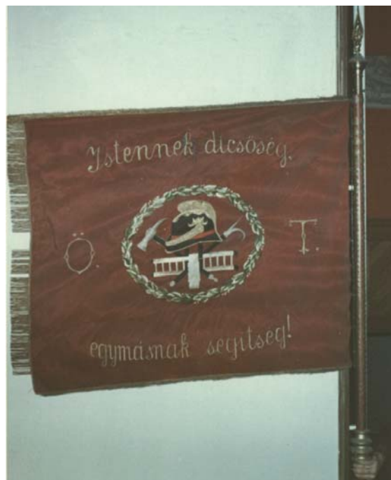
29a. és b. kép. A Karcagi Önkéntes Tűzoltó Testület zászlójának két oldala