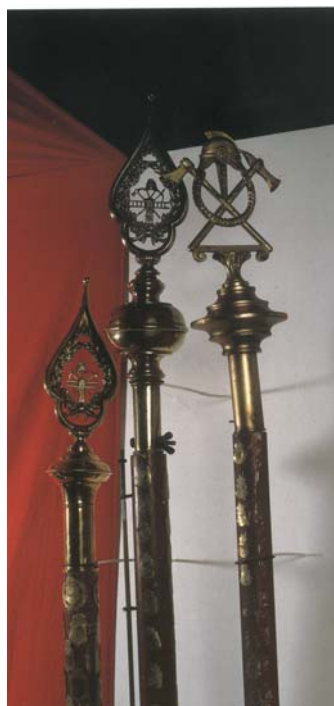
15. kép. Tűzoltó-zászlócsúcsok

A tűzoltózászlókon rendszerint megjelenítik a település tűzoltó egyletének az emblémáját, ebben a tűzoltói motívumban az elmaradhatatlan kellékek – a sisak, balta, kötél, létra, tömlő, kürt. A címer fölé kerül a tűzoltó testület megnevezése, alá a helység neve, és az esemény, vagy évforduló évszáma.