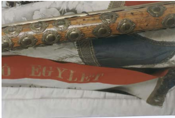
6. kép. Zászlórúd szögekkel