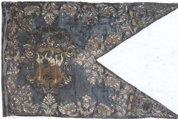
2. kép. Az Esterházy huszárezred századzászlója - 1743

A zászlóadományozás kultúrája is kialakul. Zászlót adományoznak minden gyalogos- és lovasszázadnak. A katonai alakulat első százada fehér, a többi színes zászlót kap, ez utóbbira példa 2. képen látható Esterházy huszárezred századzászlója. A zászló felirata őrzi az adományozó nevét, ennek része az alakulat megnevezése is. Egy katonai szervezet a megalakuláskor zászlót kap. A zászlócsere sem kivételes eset, ekkor háborúban a hadiérdem elismerése áll az adományozás háttérében. A zászlószalag fontos kelléke a zászlónak, amelyet kiemelkedő események alkalmával köt fel a zászlóra a zászlóanya, vagy az adományozó.