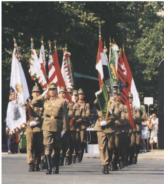
5. kép. Történelmi zászlók kereszt- és lándzsacsúcsokkal