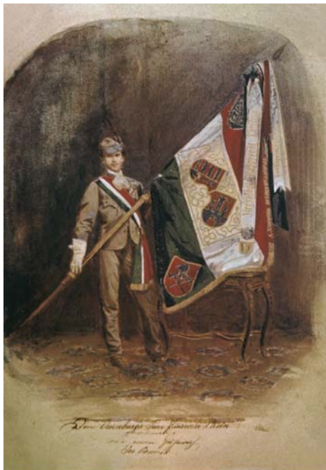
8. kép. A Soproni Torna és Tűzoltó Egylet zászlója zászlószalagokkal