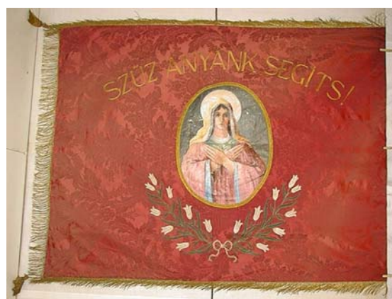
18a. és b. kép. A Boldogi Önkéntes Tűzoltó Testület zászlójának két oldala

A zászlórúd 3 méter hosszú, 4 cm átmérőjű. A zászlócsúcs sárgaréz áttört koronás címerrel, 38 cm magas. A zászlóvászon (vászonlap) 122x170 cm méretű téglalap alakú bordó selyemdamaszt, melyet a szélén – a téglalap alak három oldalán - 8 cm-es rojt szegélyez. A zászlóvászon (zászlólap) egyik oldalán ( 18a. kép ) 10 cm-es betűkkel a „KÖZJÓÉRT BECSÜLETBŐL” és a „BOLDOGI ÖNKÉNTES TŰZOLTÓ TESTÜLET” felirat körbe öleli a közepén lévő alul babérágakkal díszített - sisakból, létrából, bontóbaltákból álló - tűzoltó motívumot. A bal sarokban az 1909-, a jobb sarokban az -1924 évszám áll. A zászlóvászon másik oldalán ( 18b. kép ) „SZŰZ ANYÁNK SEGÍTS” felirat 10 cm-es betűkkel. Középen Mihalovics János: Szűz Mária - 40x60 cm-es ellipszis alakú - olaj-vászon festménye van rávarrva. A kép alatt 16 darab fehér tulipánból font állókoszorú. A hímzés gépi, a betűk arany színűek, a balták és a sisak ezüst színű. A zászlóvásznat 10 fémkarikával és arany színű rúddal lehet a rúdhoz rögzíteni. A zászlórúdon felül egy Újváry László feliratú zászlószög van, az ellendarabja hiányzik, alatta öt sorban 5x20 szeg sorakozott, ebből hat hiányzik.