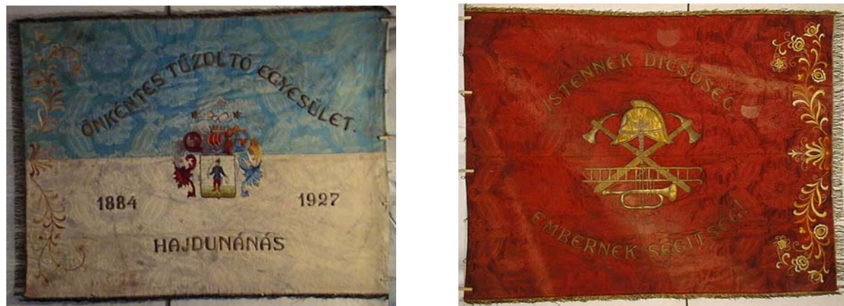
24a, és b. kép. A Hajdúnánási Önkéntes Tűzoltó Egyesület zászlójának két oldala

A zászlóvásznon (vászonlap) mérete 140x108 cm. A selyembrokát zászlólap három szélét 5 cm-es aranyrojt szegélyezi. Az egyik oldalán (24a. kép) a vászonlap hosszában kettéválasztva, felül világos türkizkék, alul vajszínű. Bal szélén napsárga és barna hímezésű ornamentika. Középen Hajdúnánás város 40 cm magas címere, 10 féle színben. A felső mezőben a címer fölött hullámvonalban haladó aranyhímzésű felirat: ÖNKÉNTES TŰZOLTÓ EGYESÜLET . A címer alatti mezőben: 1884-1927 felirat, alatta HAJDUNÁNÁS . A hátsó oldal (24b. kép) bordó színű, plasztikus köralakú aranyhímzésű felirat övezi a tűzoltó emblémát felül: ISTENNEK DICSŐSÉG, EMBERNEK SEGÍTSÉG . A közepen elhelyezkedő tűzoltó embléma – sisak, két keresztbetett balta, horoglétra, alul kürt zsinórral - aranyhímzéssel készült. A jobb szélén napsárga és barna hímezésű ornamentika.