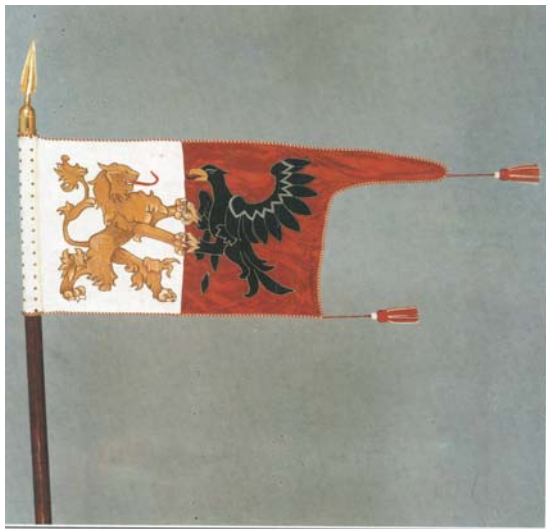
3. kép. Bocskai István hajdúinak zászlója