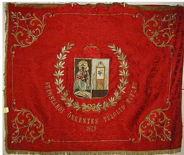
19a. és b. kép. A Szekszárdi Önkéntes Tűzoltó Egylet zászlójának két oldala