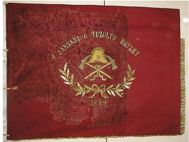
31a. és b. kép. A Sárvári Önkéntes Tűzoltó Egylet zászlójának két oldala