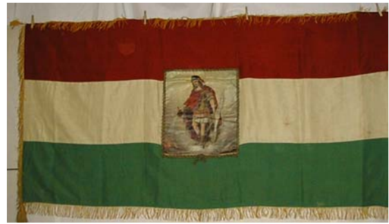
30a. és b. kép. A Karancskeszzi Önkéntes Tűzoltó Testület zászlójának két oldala