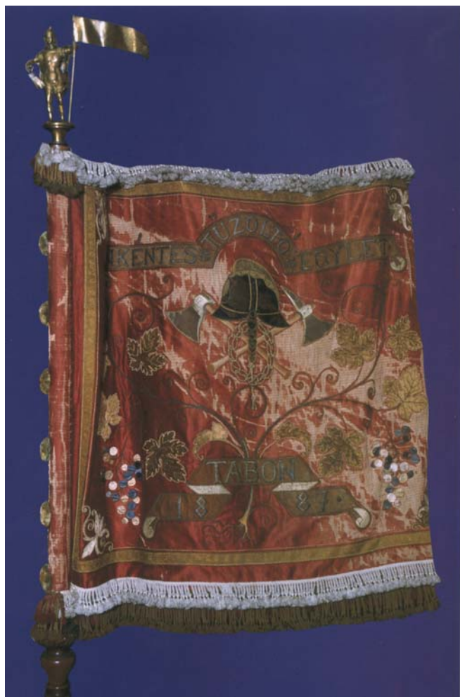
28a., kép. A Tabi Önkéntes Tűzoltó Egylet zászlójának egyik oldala

A korabeli leírás 10 szerint: „ez az első tűzoltó-zászló, mely úgy motívumainak, mint fantasztikus izlésű mintázatainak egybehangzó harmóniája és művészi kivitele a legmagasabb igényeknek is minden tekintetben megfelel. A zászló első oldala (28a. kép) bíborvörös vastagselyem tafota, ÖNKÉNTES TŰZOLTÓ EGYLET TABON 1887 vastag aranybetűs feliraton kívül az elmaradhatatlan, de rendkívüli izléssel csoportosított tűzoltó-jelvény van hímezve, körítve Somogy vármegye czimerével szőlőlugas vesszővel és két kék szőlőfürttel. A zászló másik oldalának (28b. kép) alapja fehér selyem ezt művészi kivitelben Magyarország czimere díszíti, a czimer fölött a szent korona van hímezve a leggondosabb, és minden részleteiben a legpontosabb kivitelben. A czimer és korona veretéül babér és tölgyfalevelekből font koszorú szolgál, közepén Ö.T. betűkkel. Hogy az Ö.T. betűk a babér és tölgylevélkoszorú közé van fűzve, annak némi jelentősége is van. A tabi önkéntes tűzoltó-testület ugyanis 3 év alatt 47 tüzesetben tüntette ki magát, s a zászlót ajándékozó főúr mintegy elismerését kívánta ezzel a derék testületnek gyöngéden kifejezni.