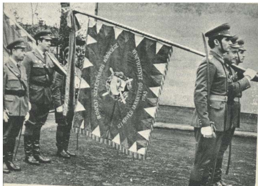
9. kép. Ünnepestes zászlóbúcsúztatás

A zászló mozgatása különleges alak szabályokhoz van kötve, a zászlóvivők és a zászlókísérő szakasz vigyázzmenetben halad, a mozgás útvonalán kötelező a tiszteletadás. A zászló könnyebb tartása érdekében a zászlóvivő felszerelésébe egy különleges, rendszerint szépen díszített vállszalag, tartozik, amelynek hüvelyébe a zászlórúd alsó vége beacsúsztható. A zászlóvivő menetben a vállára borítva viszi a zászlót.