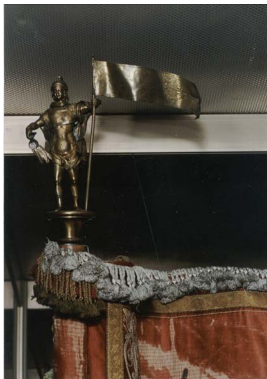
14b. kép. A Tabi Önkéntes Tűzoltó Egylet zászlójának zászlócsúcsa