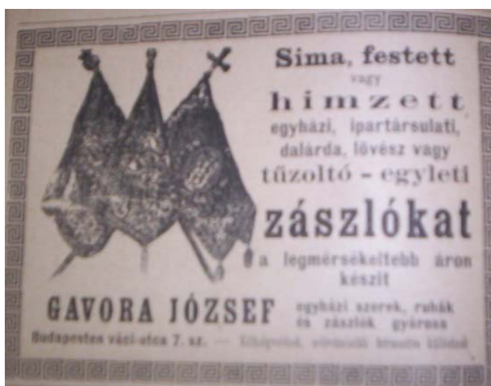
17. kép. Zászlókészítő hirdetése

A tűzoltózászlók megrendelésre készültek a műhelyek a tűzoltó folyóiratokban hirdették magukat, lásd a 17. képet.