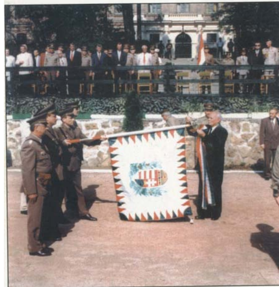
10. kép. Göncz Árpád köztársasági elnök zászlót avat

A katonai alakulatok tevékenységéről, érdemeiről, életéről sokat „mesélnek” a zászlószalagok, nézzük meg miként.