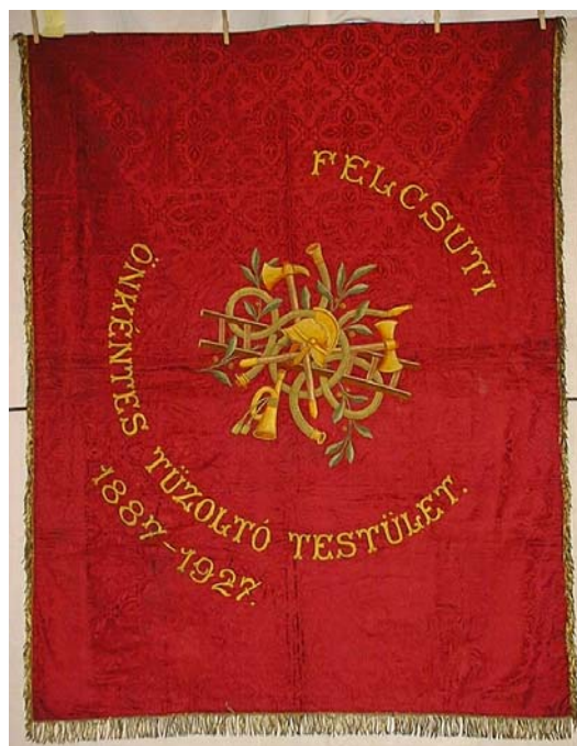
25a, és b. kép. A Felcsúti Önkéntes Tűzoltó Testület zászlójának két oldala