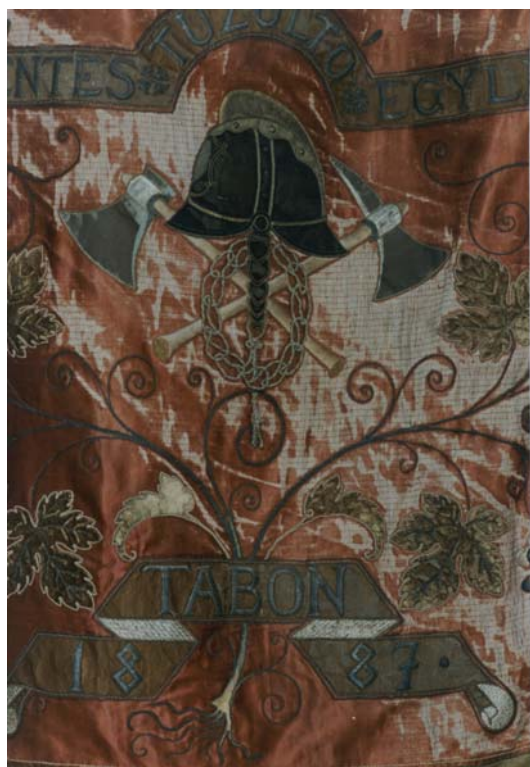
14a. kép. A Tabi Önkéntes Tűzoltó Egylet zászlójának egy részlete