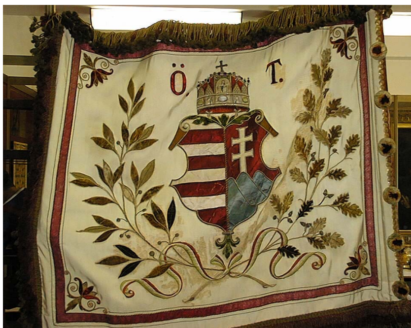
28b. kép. A Tabi Önkéntes Tűzoltó Egylet zászlójának másik oldala

A tölgylevél ugyanis az erő szimbóluma, a babérlevél pedig a győzelem jelvénye, az Ö.T. megkoszorúzásával a tűzoltók erélyes kitartása van feltüntetve, s azon a győzelmei megkoszorúzva, melyeket a bős elemek fölött annyiszor kivívott magának. Az egész kivitelben különösen kiemelkedő a véghetetlen ügyes csoportosítás, a heraldikai hűség s a gondosan