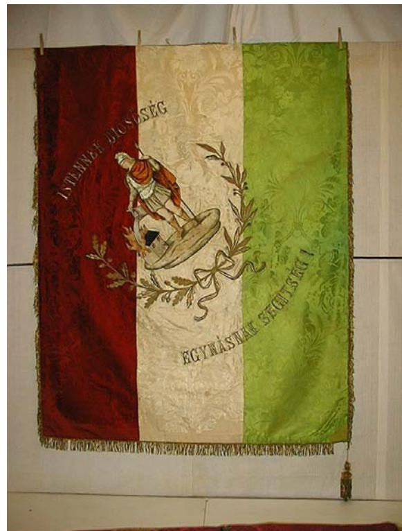
27a, és b. kép. Az Ácsi Önkéntes Tűzoltó Század zászlójának két oldala