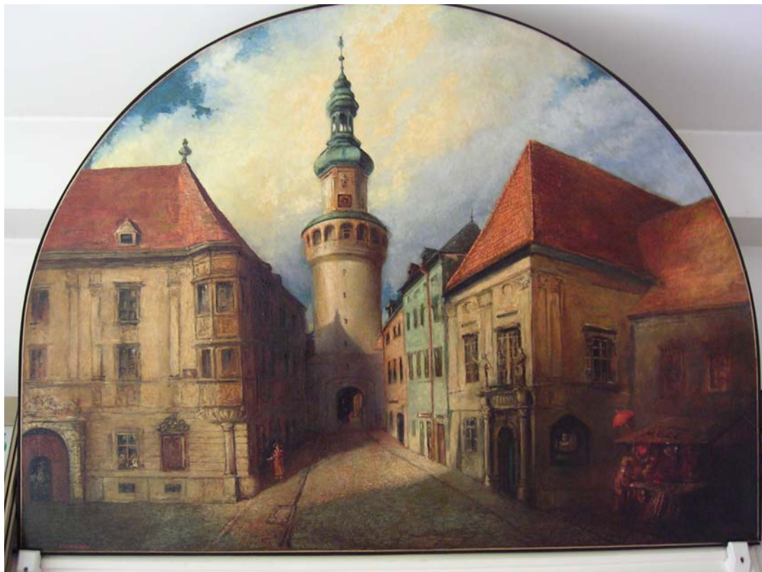
5. kép. A soproni tűztorony

A régi Sopronnak is érdekessége volt a Tűztorony ( 5. kép ). A toronyőrök elsősorban zenészek voltak, akiknek tűzfigyelési feladata is volt.