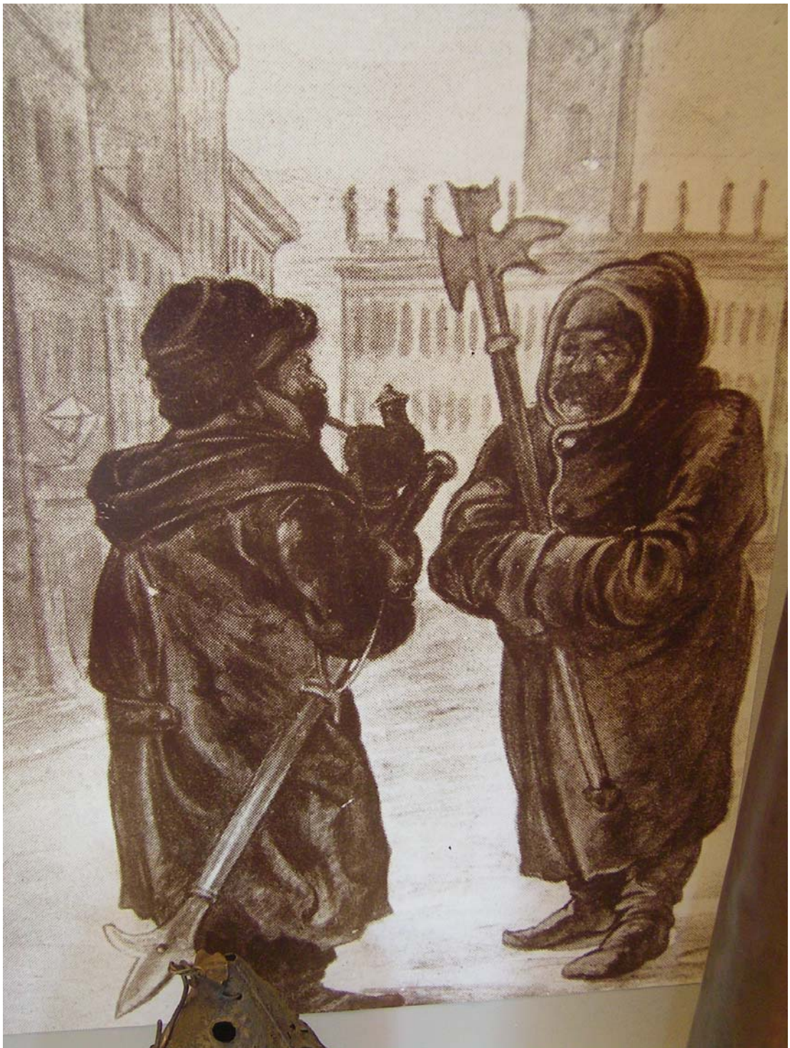
4. kép. Éjjeli őrzéskor

járőrözési útvonalán haladva fennhangon hozta tudomására a lakosoknak, hogy