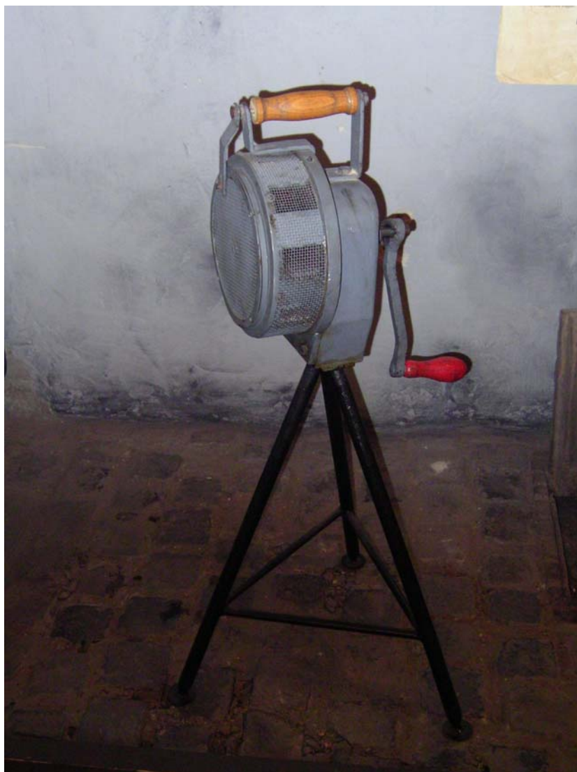
7. kép. Kézi (mechanikus) sziréna

A tűzoltóságra a polgári légvédelemben jelentős szerep hárul. Fontos feladat a polgárok védelme, a bombatámadást követő tűzveszély megelőzése, a tűz terjedésének megakadályozása, a tűz eloltása. A légoltalmi szempontok a tűzrendészeti törvényben is megjelennek. A tűzjelzés ezért közvetett módon kiegészül a légitámadást valószínűsítő, a légiriadót elrendelő jelzésekkel. A rádió közlített felhívások, a kézi légoltalmi – vagy elektromos – szirénákkal adott jelzések igen nagy valószínűséggel a tűz, vagy a tüzek bekövetkezését tudatosítják, azaz a tűzre ráutaló jelekként értékelendők. A légiriadó elrendelésének legelterjedtebb eszköze a kézi (mechanikus) sziréna volt. (7. kép.)