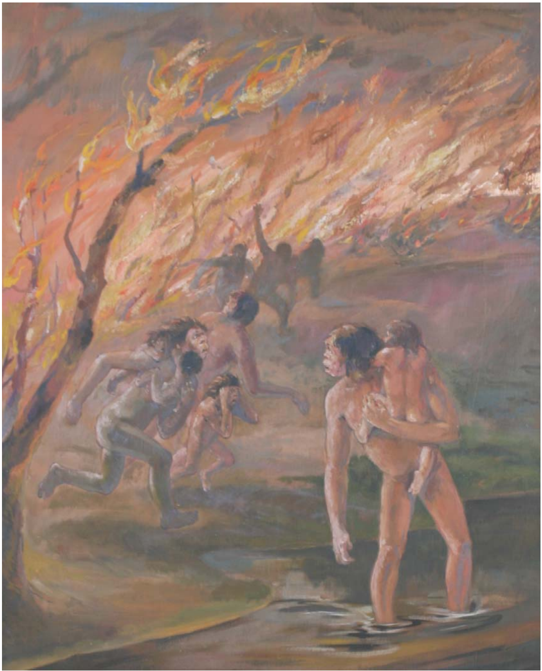
1. kép. Régvolt elődeink és a tűz

Őseink az idők folyamán azt is megfigyelték, hogy a folyók, a kopár hegyek, sivatagok, a hóval és jéggel fedett hegyek gátat vetnek a tűznek. Ezek védőpajzsok, mert a tőlük távol keletkezett terjedő tüzet elszigetelik, a tűz káros hatásai nem érvényesülnek. Ezeket a természetes akadályokat kihasználva a lakóhelyet kedvező helyen lehet megválasztani. Ez azonban nem jelentette az ártó tüztől való mindenkorra érvényes „távolmaradást.”