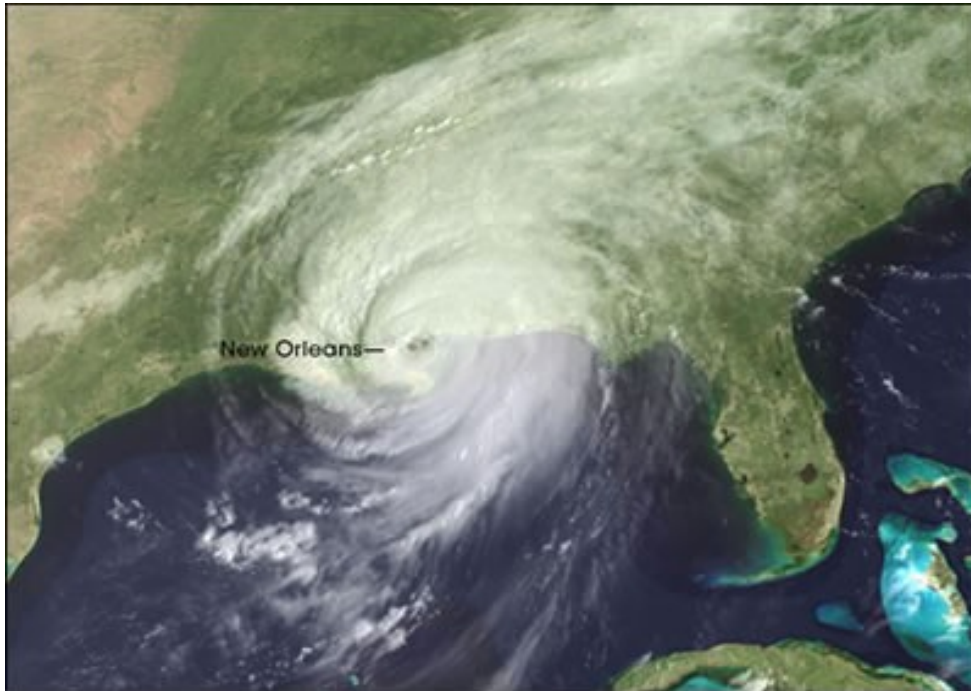
Hurricane Katrina in 2005

hogy a trópusi vihar több napra lakhatatlanná teszi az érintett régiót, számítani kell a hetekig tartó áramkimaradásokra és ivóvízhiányra. A közlemény hatására az államok kormányzói (Louisiana, Mississippi és Alabama állam) kötelező kitelepítésre szólította fel a lakosságot. Másnapra számos nagy vasúttársaság beszüntette a vonatközlekedést a déli területeken köztük a személyszállítással foglalkozó Amtrak is, amelynek közvetlen járatai voltak New Orleans-ba. Ezen a napon állt le a Waterford-i atomerőmű is.