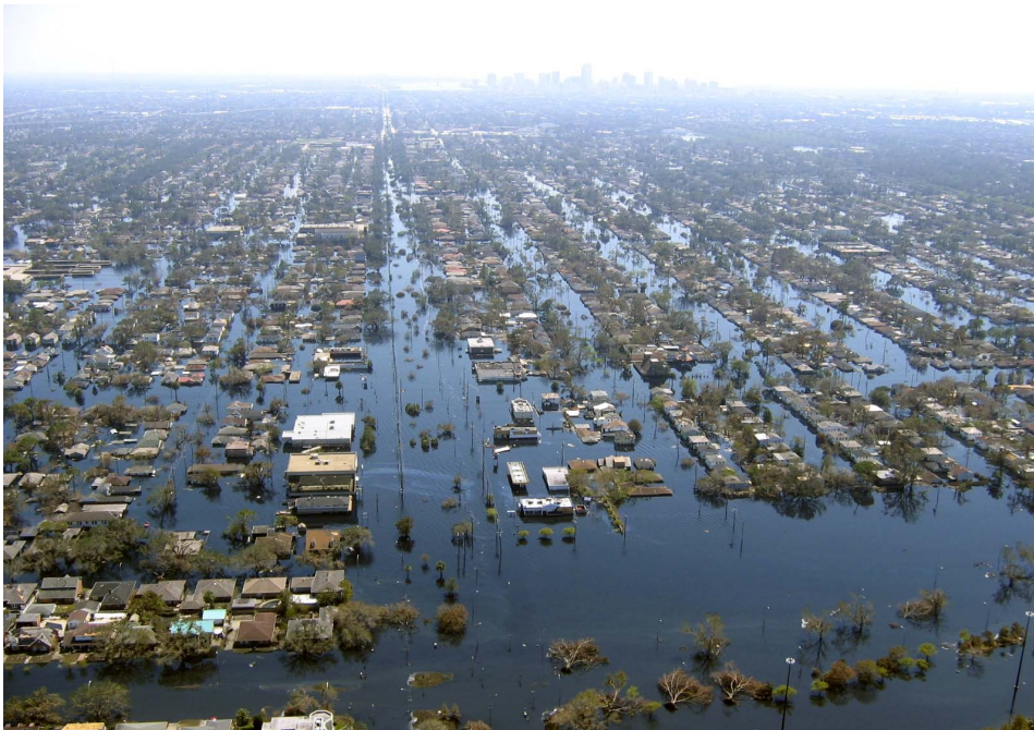
New Orleans after Hurricane Katrina

A legnagyobb kritikát a mentőalakulatok késése miatt kapta az állam és a szövetségi kormány. A mentések közel két-három napot késtek, aminek következtében élelem- és ivóvízhiány alakult ki. A mentőalakulatok nem győzték a háztetőkről menteni az embereket. A katonaság és a parti őrség helikopterei élelmiszer- és ivóvízkészleteket dobtak le a lakosság számára. A kormány bejelenti, hogy zéró toleranciát hirdet a fosztogatókkal szemben, fegyveres gardisták és rendőrök őrzik az élelmiszerosztást.