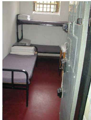
8-9. számú kép A budapesti Kozma utcai börtön.

Magyarországon napjainkban körülbelül 17-18.000 fő fogvatartott van. Az őrzésükkel, szállításukkal és az egyéb járulékos feladatokkal a mintegy 4.000 fős büntetés-végrehajtási állomány foglalkozik. Jelenleg – az igen nagy zsúfoltság miatt - Tiszalökön és Szombathelyen is új börtönt alakítanak ki.