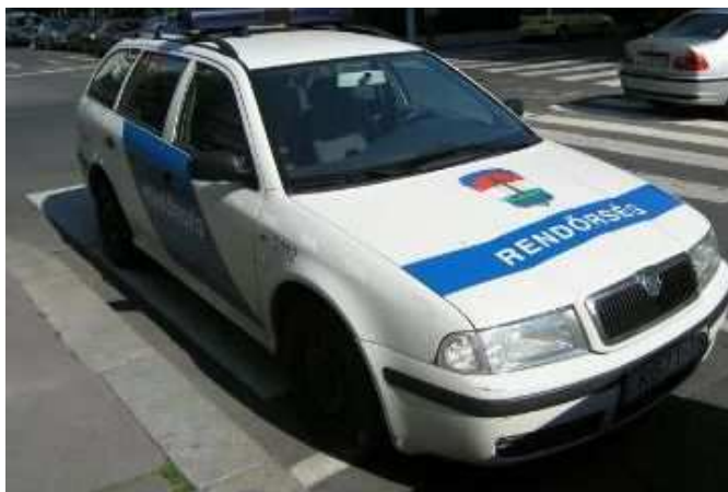
17. számú kép, ORFK karjelzés és egy a rendőrség szolgálati gépjárműveiből