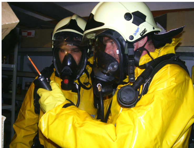
20. számú kép, a VFCS állománya gyakorlaton a Berettyóújfalui Területi Kórházban

Rossz lesz, mivel a változtatások hátrányosan fogják érinteni az összes hivatásost.