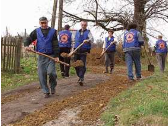
6. számú kép. Védekezési munkálatok.