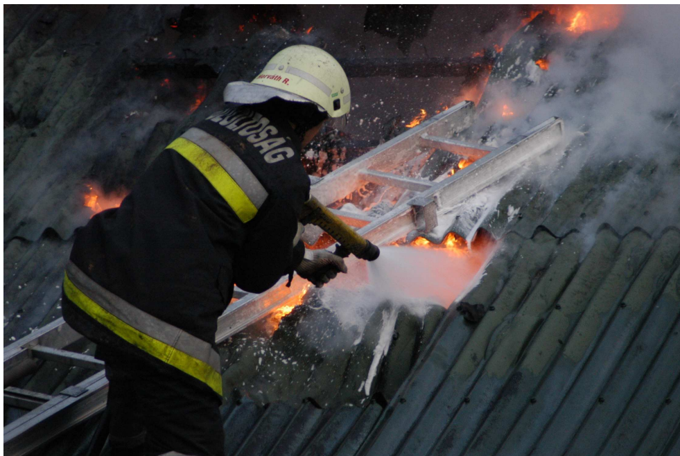
18. számú kép. Tetőszerkezet lángokban, Forrás: Méhes Ákos, 2006.

Az elérhető fegyveres és rendvédelmi dolgozók közül egyenlő arányban próbáltam célszemélyeket keresni, arra figyelve, hogy az egy szervnél állományban lévők eltérő rendfokozati állománycsoportban legyenek (Tisztek és tiszthelyettesek, zászlósok).