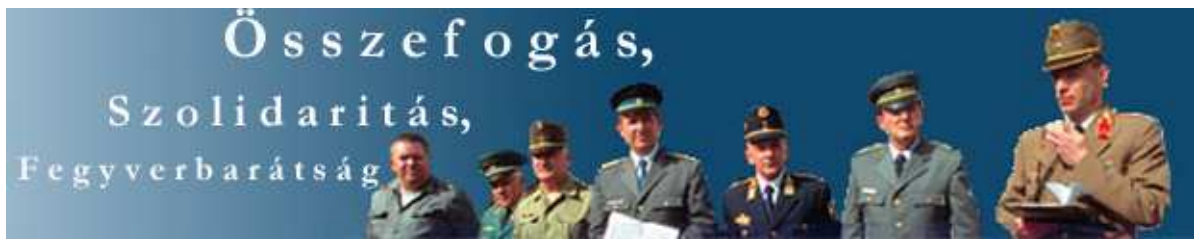
24. számú kép. Az FRDÉSZ fejléce.