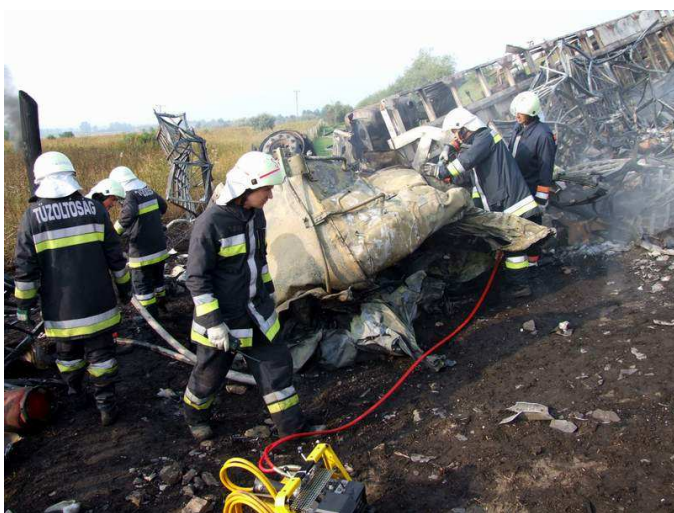
13. számú kép