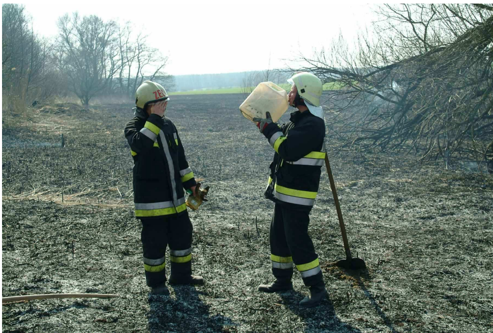
25. számú kép, Erdő és avartűz után, Forrás: Tánczos Mihály, 2006.

Így utólag, a dolgozat végén már látom, hogy nem egyszerű témát választottam. Ha igazán átfogó akar lenni valaki a témával kapcsolatosan, akkor figyelembe kell venni sok-sok részinformációt és adatot is.