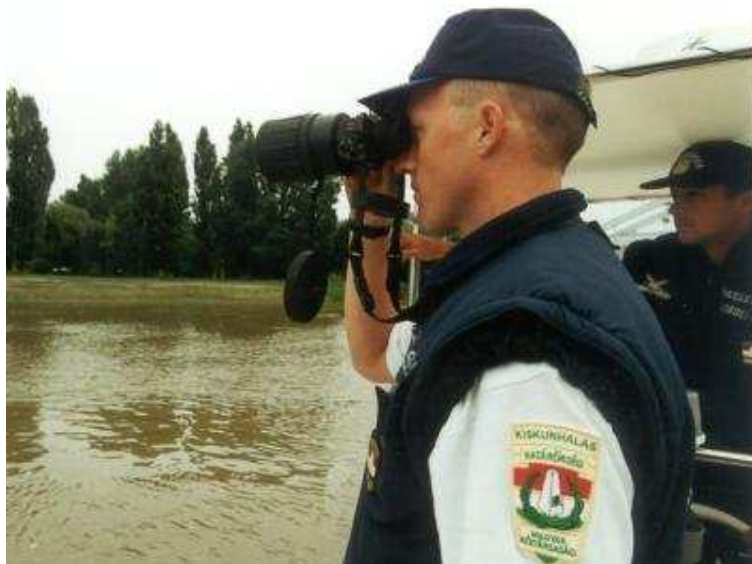
3. számú kép. Határaink ellenőrzése

A Határőrség legfőképpen határőrizeti, személy és gépjármű határforgalmi és bűnügyi-felderítő (határrendészeti) feladatokat lát el. Tehát az államhatár őrzése mellett rendészeti tevékenységei is vannak az állományához tartozó körülbelül 10.000 főnek.