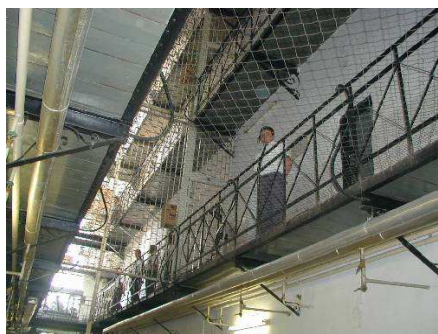
10. számú kép

A büntetlen előélet ellenőrzéséhez a (3) bekezdésben felsoroltak írásbeli hozzájárulását csatolni kell. A büntetlen előéletnek való megfelelést a büntetés-végrehajtási szerv a szolgálati viszony létesítésekor ellenőrzi, annak fennállása alatt pedig ellenőrizheti.” 9