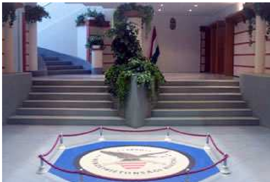
14. számú kép Az NBH előtere.

„A polgári nemzetbiztonsági szolgálatok hivatásos állományú tagja fontos és bizalmas munkakört betöltő személynek minősül.....A polgári nemzetbiztonsági szolgálatok hivatásos állományú tagja külföldre utazásának tervezett napját, útvonalát, célját, hazatérésének várható időpontját az állományilletékes parancsnoknak köteles bejelenteni. Az állományilletékes parancsnok a külföldre utazást szolgálati és biztonsági érdekből megtilthatja, illetőleg korlátozhatja.” 12