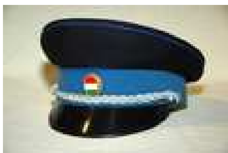
5. számú kép. Tiszthelyettesi rendőr tányérsapka.

Viselete az új típusú (baseball) sapka mellett megengedett.