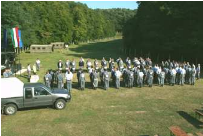
19. számú kép

áldozatvállalást, amit végzünk. A kedvezményeket véleményem szerint KELL adni. A folyamatos nyírbálásokkal nem lehet a rendvédelmet elég magas szintre emelni. Vannak pénzben nem nyújtható kedvezmények, ami csak a szféra tagjainál jelenik meg és mára már főleg ezek tartják meg a jó szakembereket a pályán. Várható, hogy a juttatások csökkentésekor ezek eltávoznak az állományból.