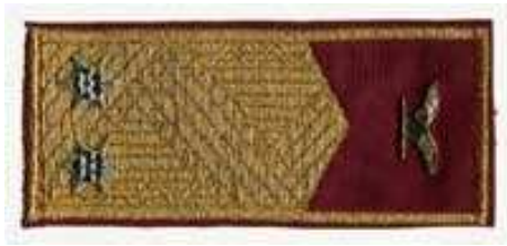
2. számú kép. Alezredesi rendfokozati jelzés.

Például.: rendőr orvos alezredes, tűzoltó törzssászlós – hírközpont-kezelő, pénzügyőr őrmester – kutató, határőr százados – osztályvezető,