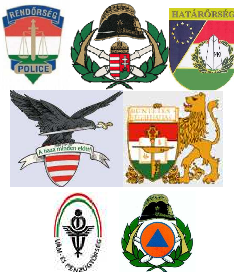
1. számú kép. Mozaik a fegyveres és rendvédelmi szervek jelképeiből.

„A Magyar Köztársaság függetlenségének, alkotmányos rendjének, valamint a lakosság és az ország anyagi javainak védelmét ellátó szervek hivatásos állományától az állam tántoríthatatlan hűségét, bátor helytállást követel.”