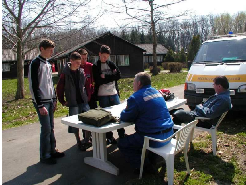
22. számú kép polgári védelmi tájékoztatása fiataloknak