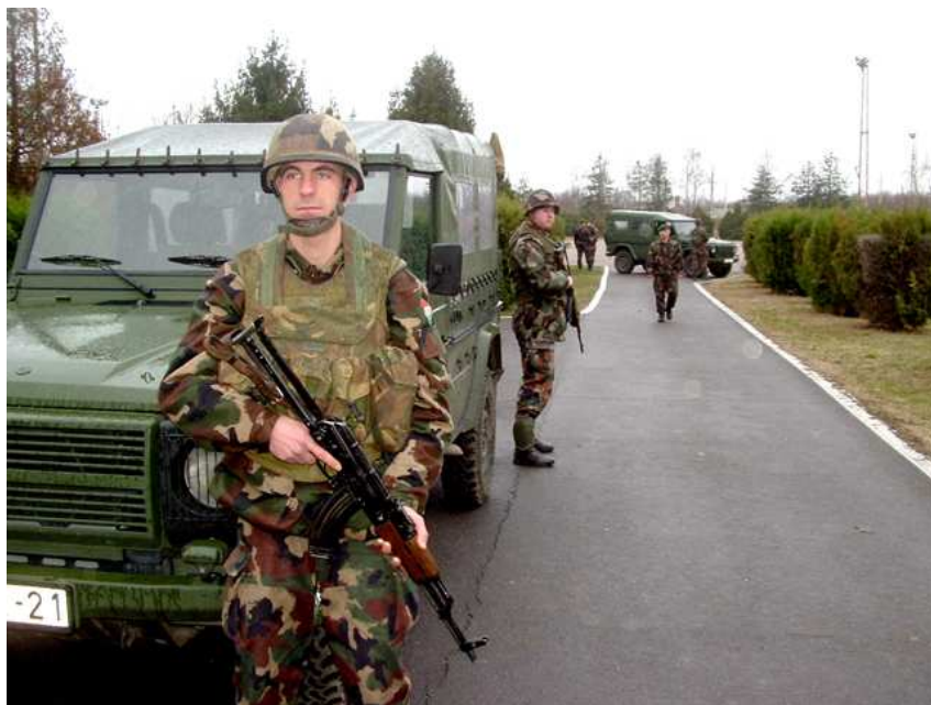
16. számú kép, szolgálatban a honvédek,

További feladatai: hozzájárul más, közösen vállalt szövetséges küldetésekhez, részt vesz a nemzetközi szervezetek által zajló béketámogató és humanitárius akciókban, segítséget nyújt a súlyos ipari és természeti katasztrófák elhárításánál.